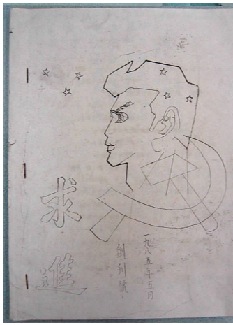
求进老照片——创刊号封面