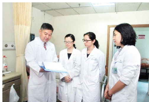
▲ 宋尔卫院士(左一)查房带教

2020年10月起担任深汕中心医院筹建小组副组长,她全力推动院区建设和医院开业各项准备工作,使深汕中心医院在开业之初就具有高水平医院强大的技术人才队伍,建立汕尾首个医学“广东省博士工作站”。坚持以“病人为中心”的服务理念,开展临床专科同质化建设和管理,更好为人民群众健康提供有力保障。遵循以临床为导向的科学研究理念,从事乳腺肿瘤手术治疗和综合治疗,对乳腺肿瘤早期诊断、早期治疗及精准放疗个体化精准治疗有深入的研究,带领团队攻坚克难,全面开展乳腺疾病各项诊疗工作。治学严谨,师承重教,培养了一支技术过硬的年轻骨干队伍,活跃在医疗、科研、教学各个岗位上,共同为人民群众医疗卫生健康事业奋斗。