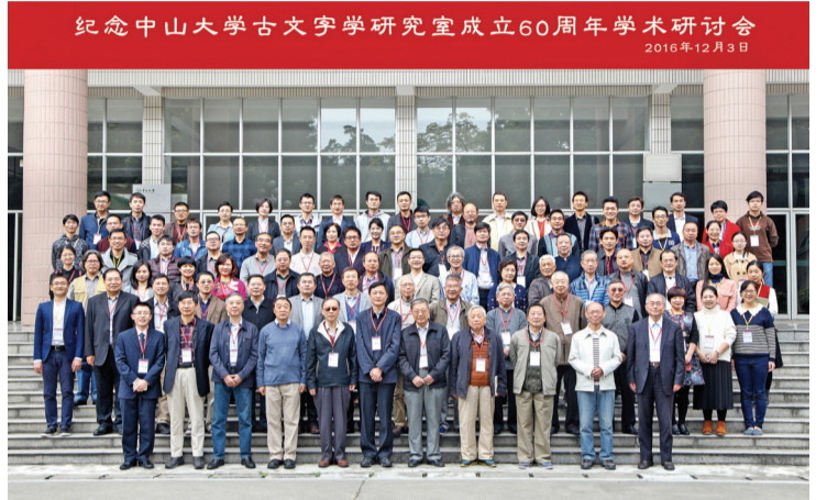
纪念中山大学古文字学研究室成立60周年学术研讨会 2016年12月3日