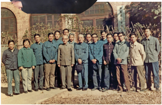
容商二老与室人员、研究生、古文字学培训班学员合影